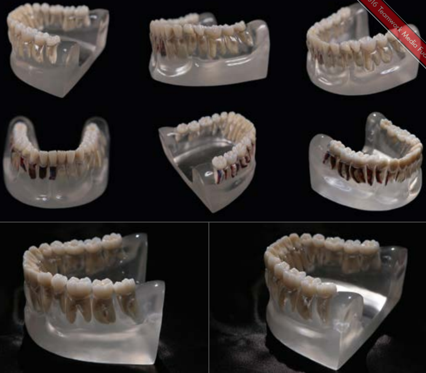
09 - 16 Die Schuarbeit gibt den Blick auf die Wurzeln und teilweise sogar auf deren Pulpen frei. Der verwendete glasklare Prothesenkunststoff (Xthetic prime, AcrylX GmbH), in dem die Wurzeln und aufgeschnittenen Wurzeln stecken, stellte sich als perfekt heraus. Für die Blutgefäße kam ein lichthärtender Modellierkunststoff aus der Spritze zum Einsatz (LumiX Gel, AcrylX GmbH)